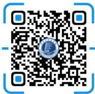
图书馆微信公众号